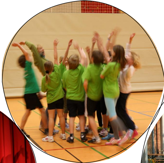
Jahrgangsturniere im Völkerball