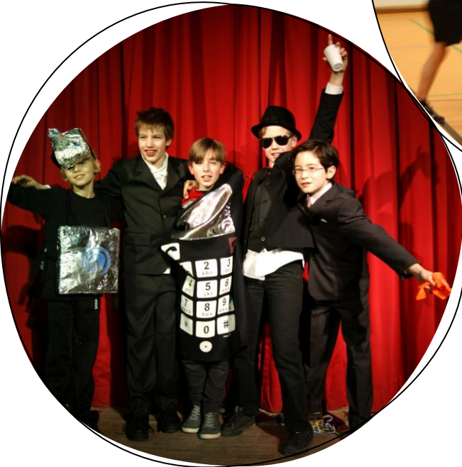
Halloween & Fasching